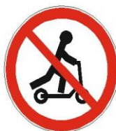
Рисунок 9. Дорожный знак 3.35 «Движение лиц на средствах индивидуальной мобильности, запрещено»

Мы катаемся на скейтах, Роликах и самокатах, Гироскутерах, моно-колесах. А по правилам, ребята? Мы должны понять, что СИМы – Средства транспортные тоже! Знание правил их вождения. Жизни сохранить поможет!